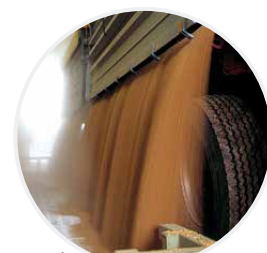
Recepción de Grano